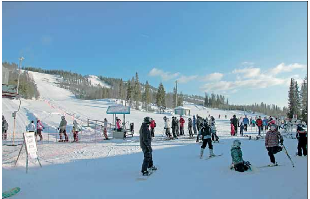
Paljakassa on panostettu lasten ja nuorten viihtyvyyteen, mikä myös näkyy rinteissä. Lapset ja nuoret ovat viihtyneet Paljakassa.

Paljakassa on myös panostettu erilaisten lippujen ja lippu-