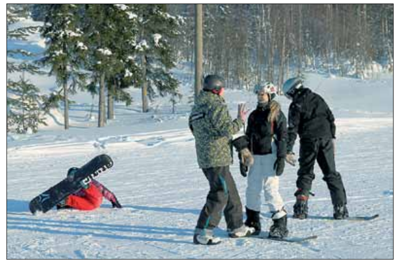
Hiihtokoulu Paljakan Porot opastaa tulevanakin talvena niin laskettelun kuin lautailun aloittaneita kuin myös pidemmälle ehtineitä laskijoita.