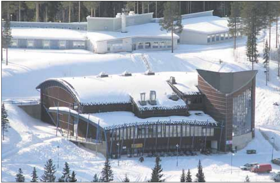
Paljakan alueen tulevaisuus näyttää valoisalta. Hotelli avataan jälleen talvisesongille, Paljakkatalossa toimii nyt luontoinfo ja kalastuspuistohanke tarjoaa toteutettuaan monipuolista uutta tekemistä etenkin kesäajalle.

- Kalastuspuiston ympärille tullaan jat-