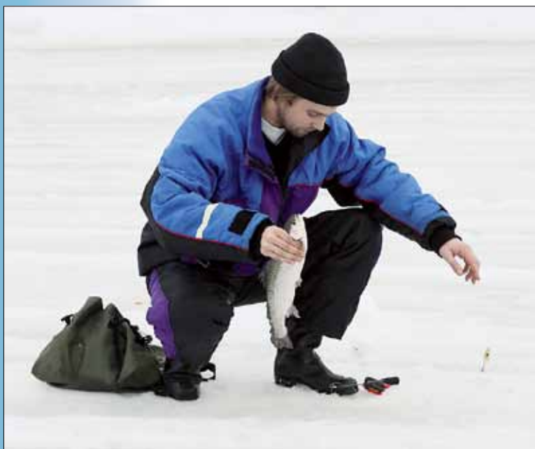
Paljakka Pilkit alkavat perjantaina Tassulammen Lohipilkeillä.

P aljakassa jo perinteeksi muodostunut vähän koloja mutta runsaasti hyviä palkintoja sisältävä Paljakka Pilkit pilkitään jälleen ensi keväänä silloin jo kahdeksannen kerran. Yksi kevään suurimmista tapahtumista järjestetään 13.-15. huhtikuuta. Perjantai-iltana lohkipilkeillä alkavan kisaviikonlopun pääkisat ovat lauantaina ja